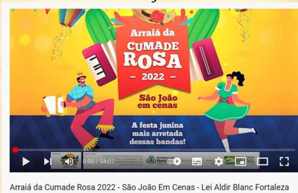
Arraiá da Cumade Rosa 2022 - São João Em Cenas - Lei Aldir Blanc Fortaleza

LINK APRESENTAÇÃO DO PROJETO : https://www.youtube.com/watch?v=HL-3Evv9GQ