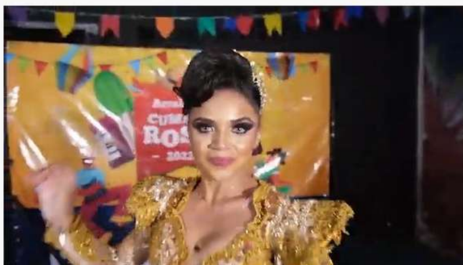
Arraiá da Cumade Rosa 2022 - São João Em Cenas - Lei Aldir Blanc Fortaleza

LINK APRESENTAÇÃO DO PROJETO : https://www.youtube.com/watch?v=HL-3Evv9GQ