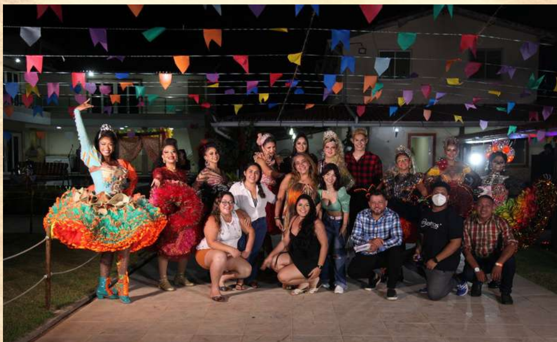
EQUIPE DE PRODUÇÃO COM AS RAINHAS