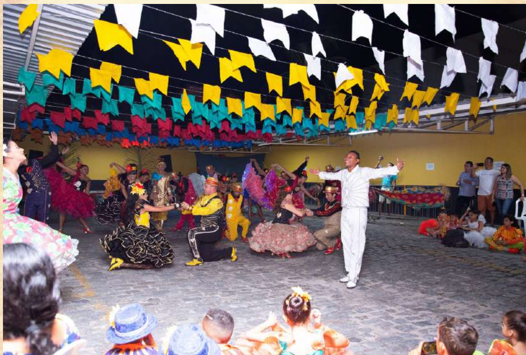
APRESENTAÇÃO DE GRUPOS JUNINOS- ADULTO E INFANTIL - JULHO DE 2019