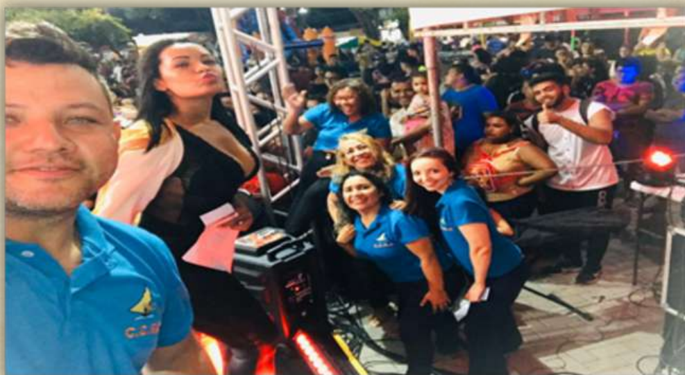
2019- 1ª Amostra de Talentos - Música e Dança

Em janeiro de 2019-“ 1ª amostra 'Talentos da Perifa” , na praça do Beira Rio Vila Velha, onde apresentou para a comunidade o trabalho de jovens artistas locais, nas áreas da dança e da musica. Proporcionando um momento de entretenimento e lazer a comunidade, como também fomentar a cultura periférica de nossa cidade.