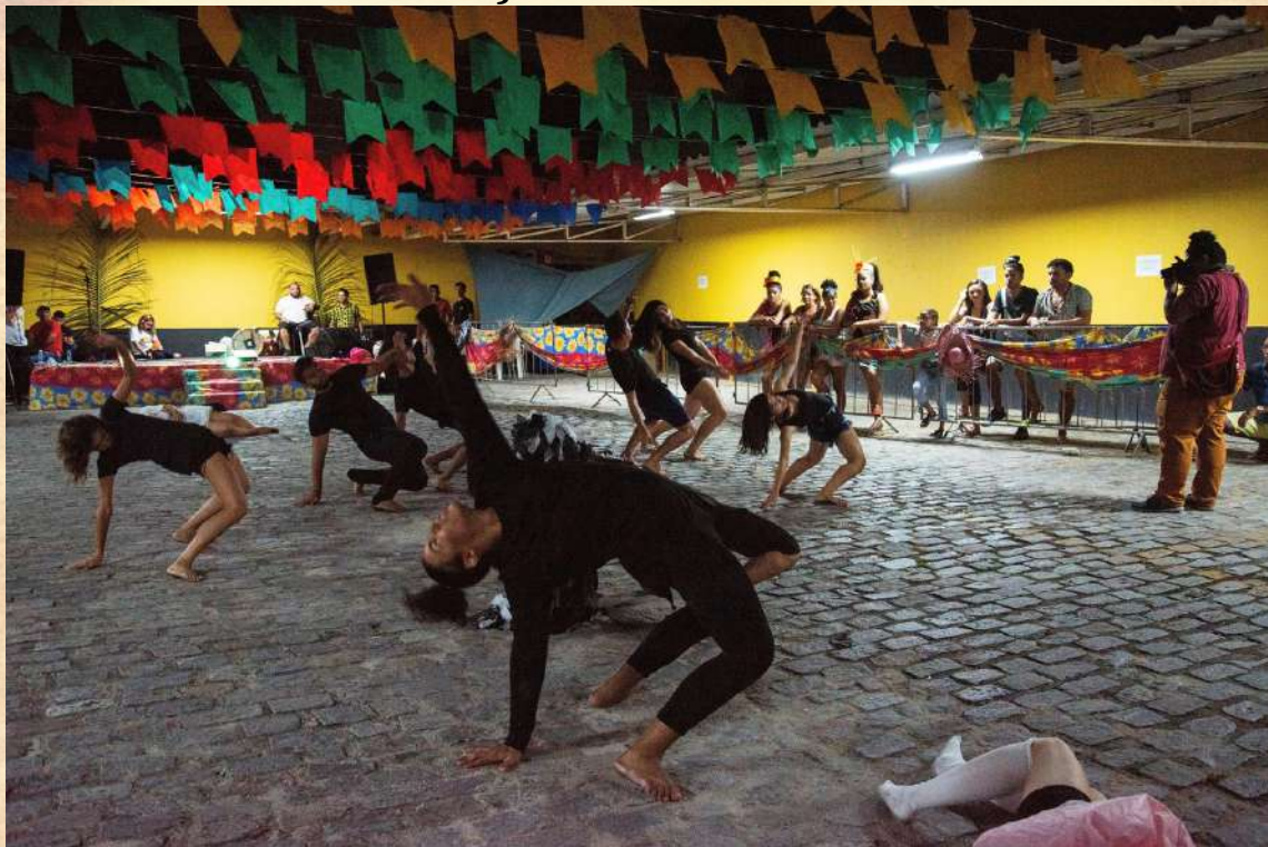
APRESENTAÇÃO DE GRUPOS ARTÍSTICOS - JULHO DE 2019