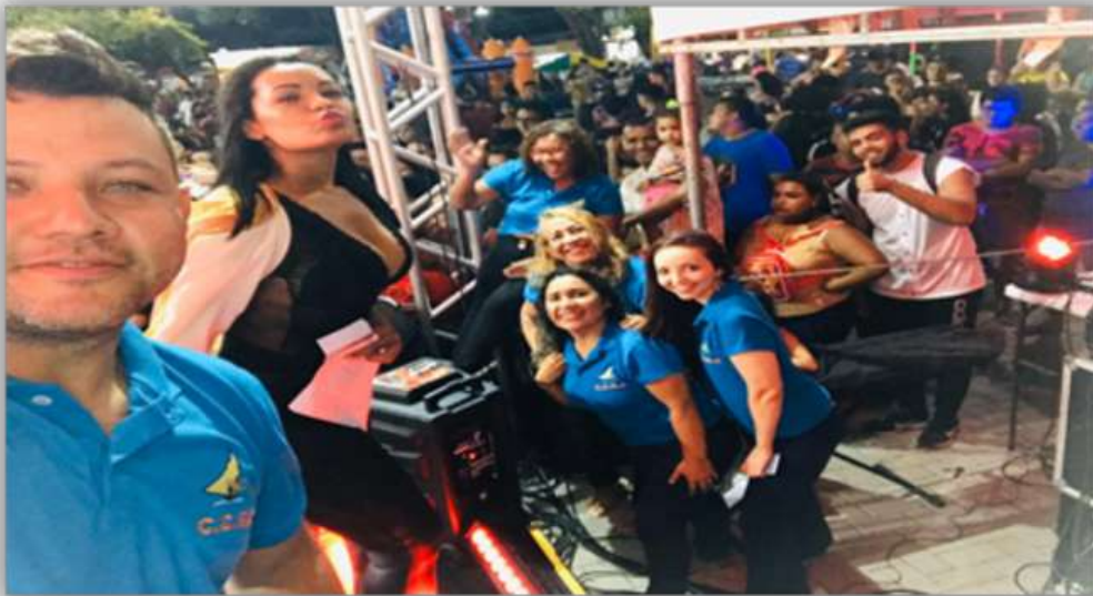
2019- 1ª Amostra de Talentos - Música e Dança

Em janeiro de 2019-“ 1ª amostra Talentos da Perifa” , na praça do Beira Rio Vila Velha, onde apresentou para a comunidade o trabalho de jovens artistas locais, nas áreas da dança e da musica. Proporcionando um momento de entretenimento e lazer a comunidade, como também fomentar a cultura periférica de nossa cidade.