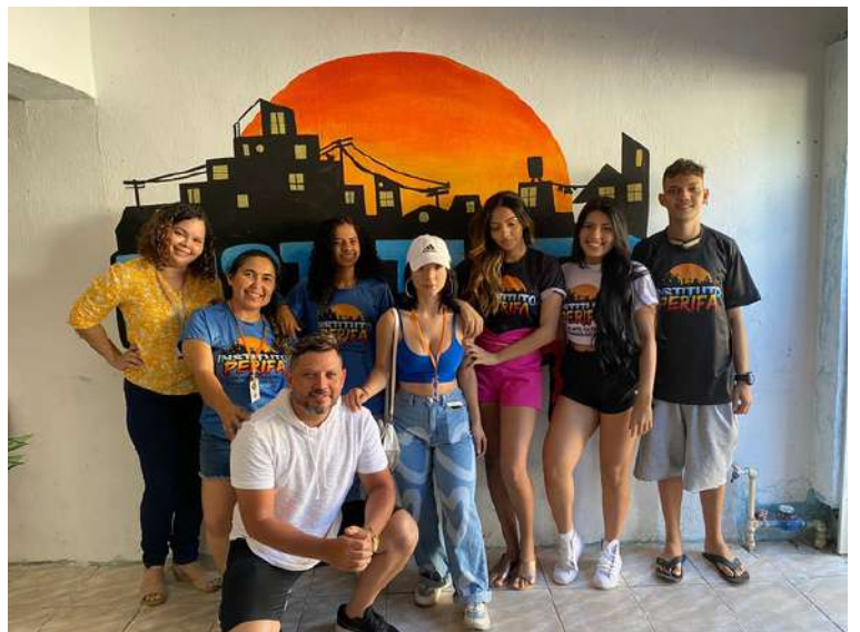
EQUIPE - IPAC-CE .