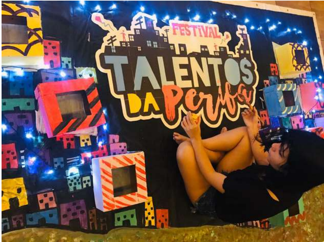
2020- Festival Online “Talentos da Perifa 2020 #meutalentodendicasa”