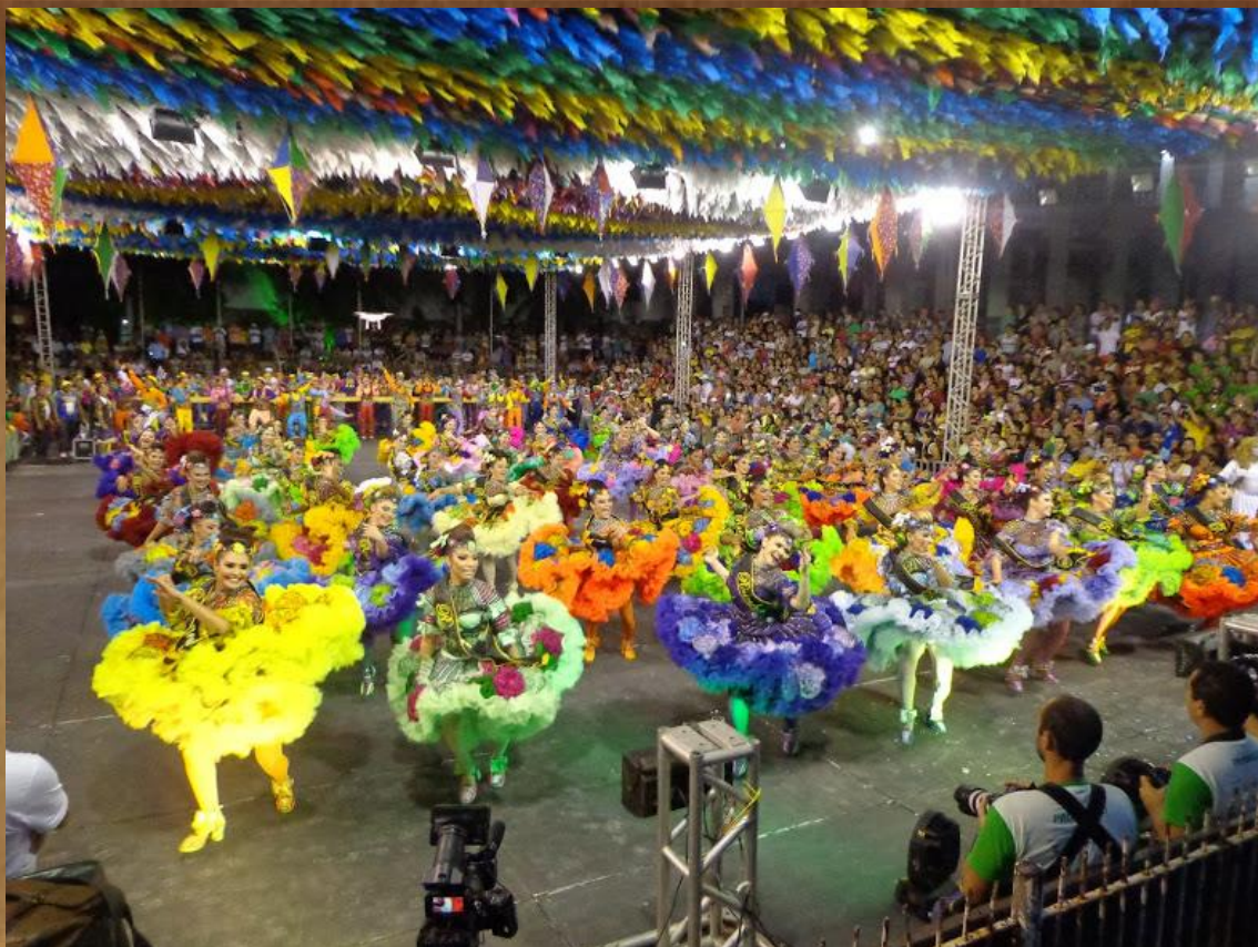
Produtor artístico – Quadrilha Paixão Nordestina 2014 Temática com narrativa “Os medos no São João”