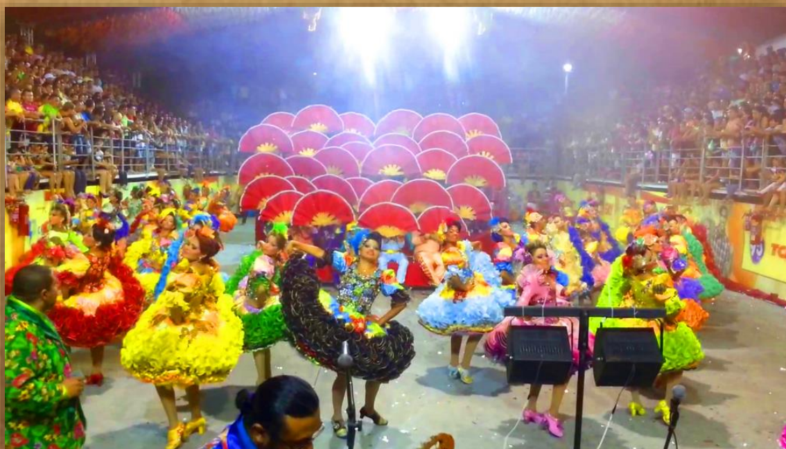
Produtor artístico – Quadrilha Paixão Nordestina 2013 Temática com narrativa “O Averso do Averso”