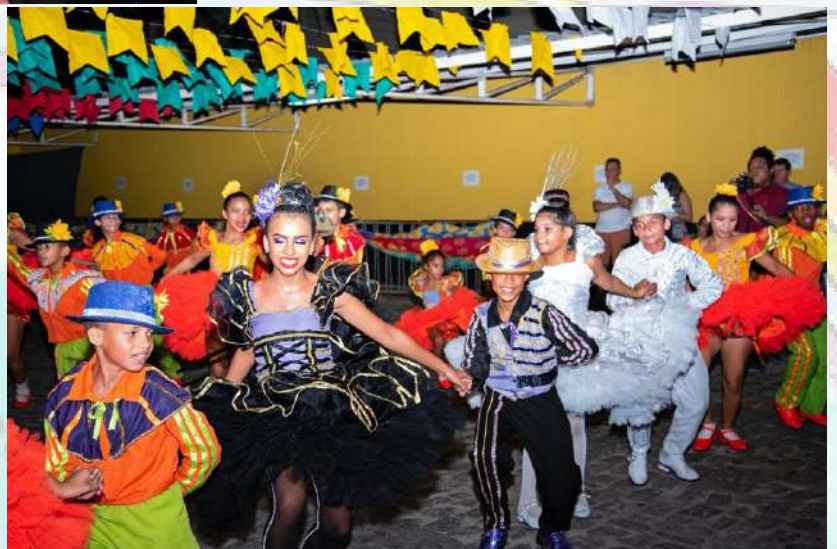
PRESENTAÇÃO DE GRUPOS JUNINOS - JULHO DE 2019