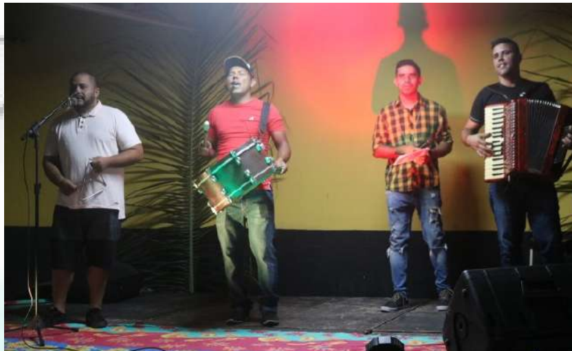
REGIONAL REI DO BAIÃO -