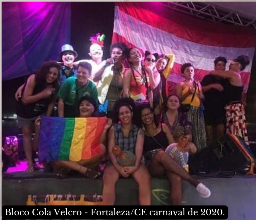
Bloco Cola Velcro - Fortaleza/CE carnaval de 2020.