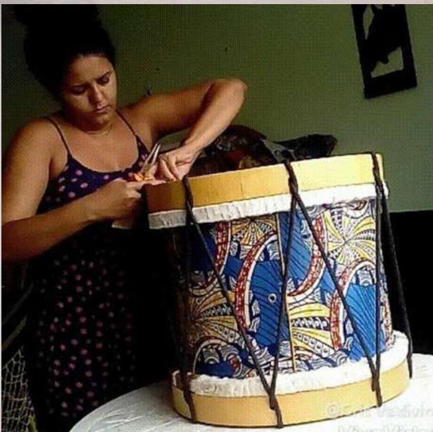
Fotos de acervo pessoal referentes ao Ateliê Coisa de Preta - Confeção e Manutenção de Instrumentos Percussivos