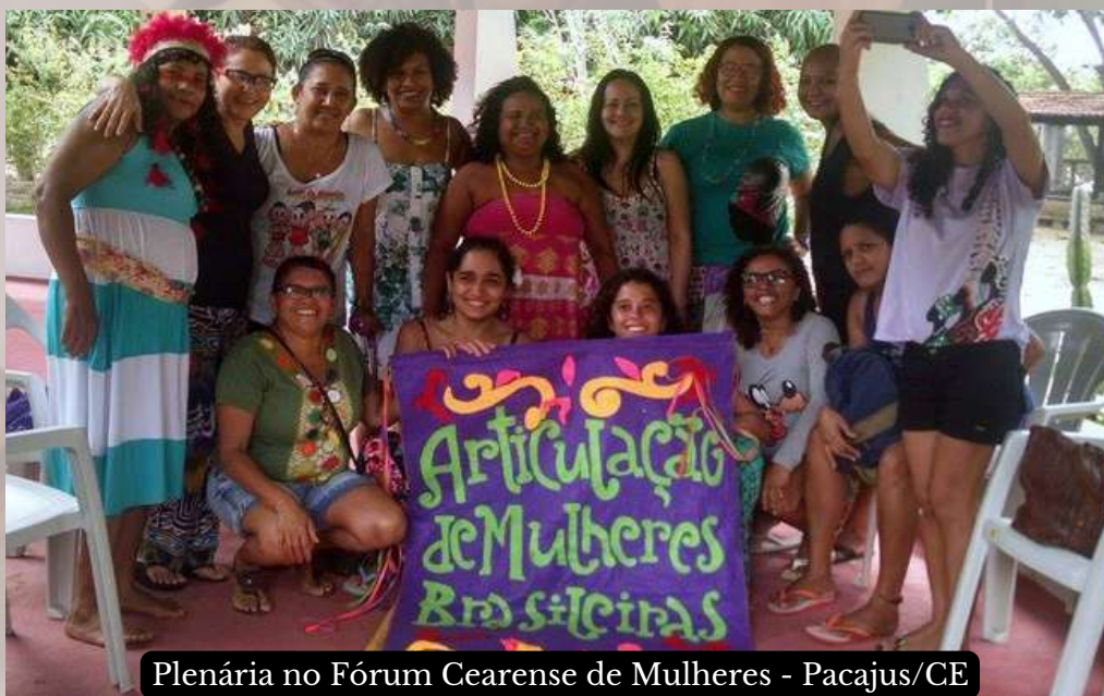
Plenária no Fórum Cearense de Mulheres - Pacajus/CE