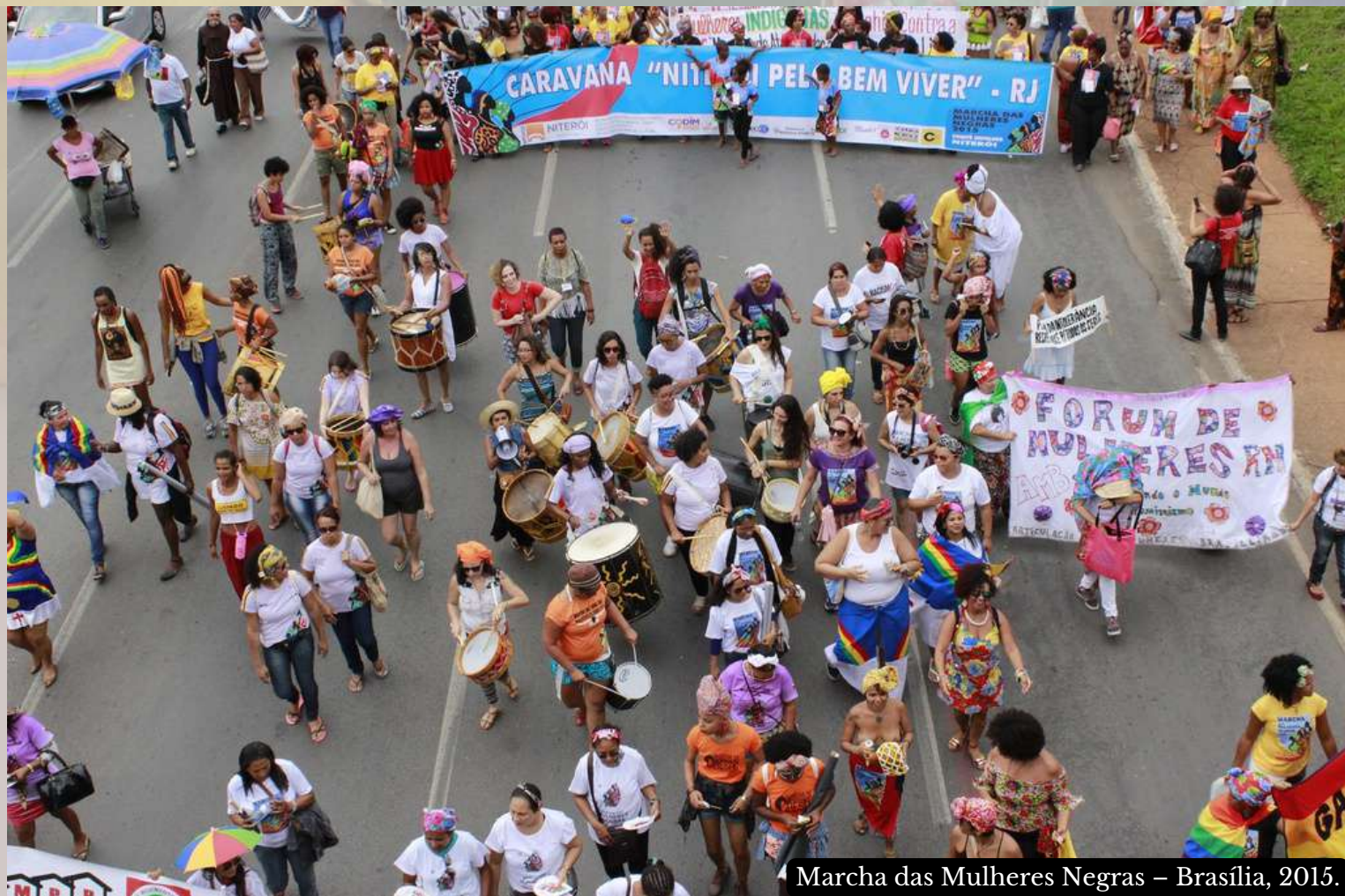
Marcha das Mulheres Negras – Brasília, 2015.