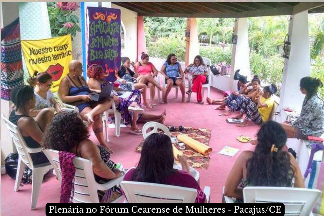
Plenária no Fórum Cearense de Mulheres - Pacajus/CE