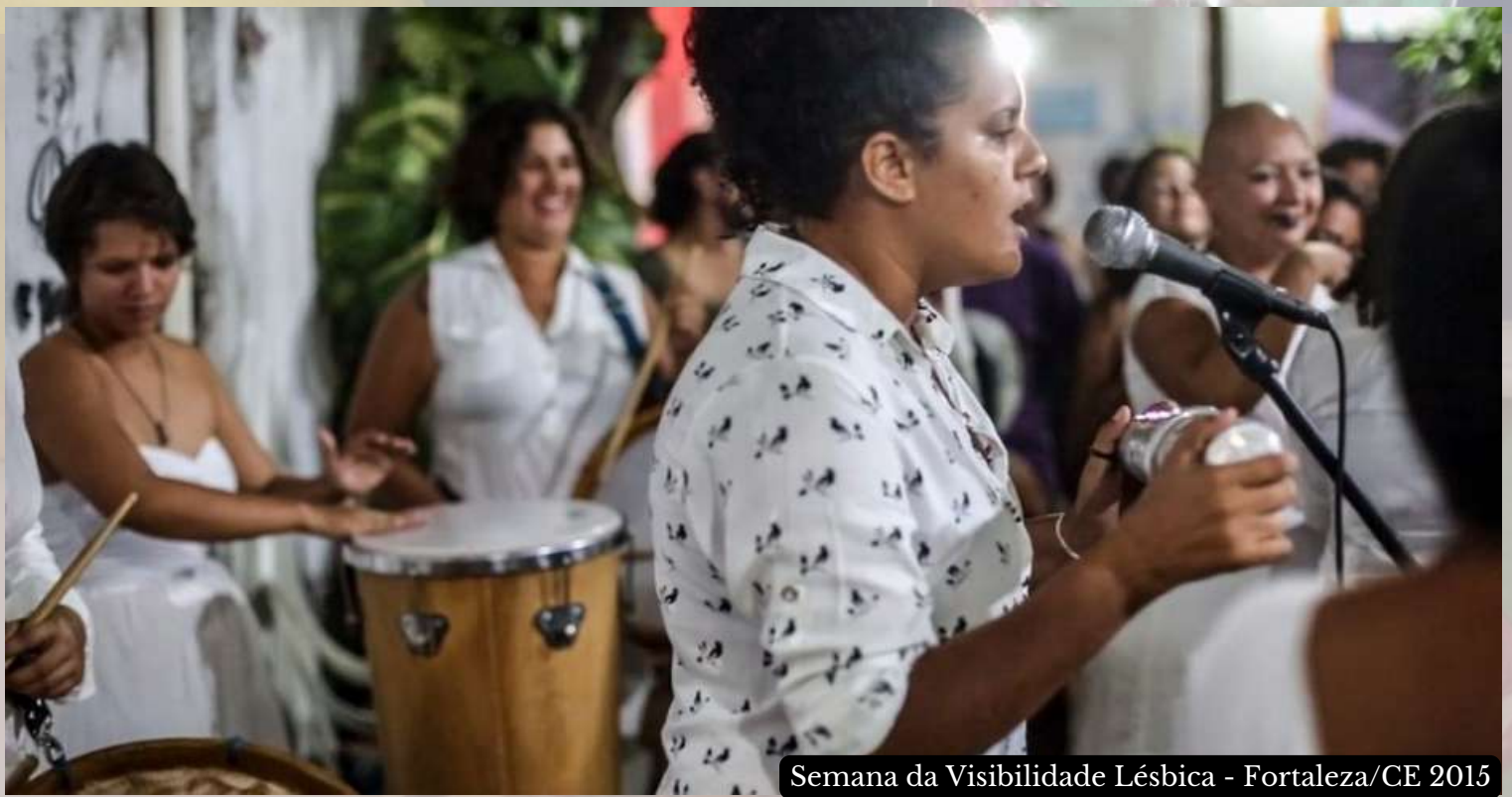
Semana da Visibilidade Lésbica - Fortaleza/CE 2015