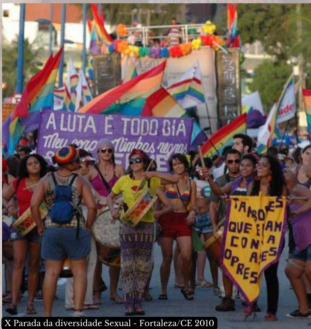
X Parada da diversidade Sexual - Fortaleza/CE 2010