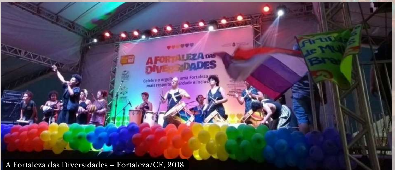
A Fortaleza das Diversidades – Fortaleza/CE, 2018.