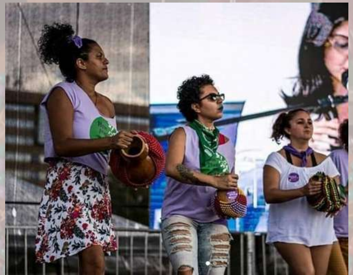
Festival pela vida das Mulheres - Brasília/DF 2018