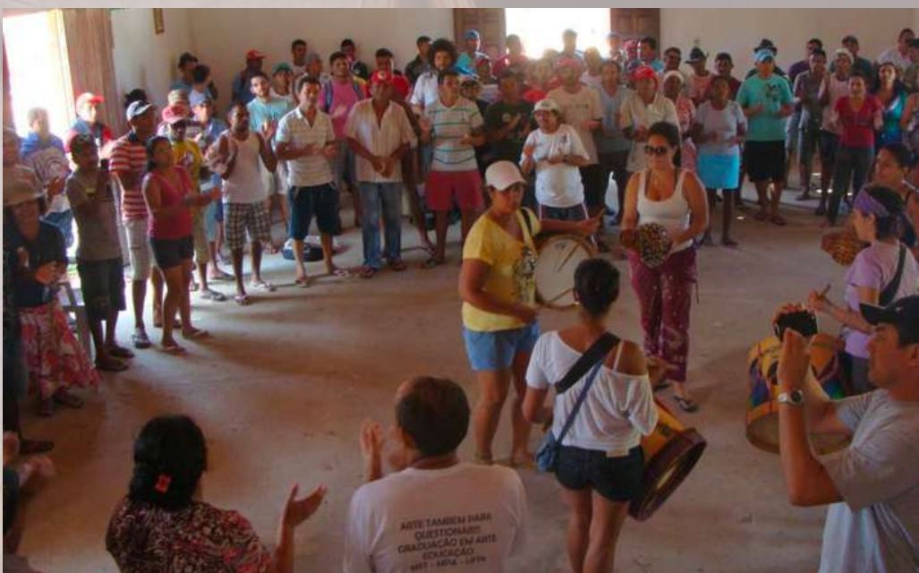
Ato contra a especulação imobiliária na Zona Costeira. Amontada/CE 2013