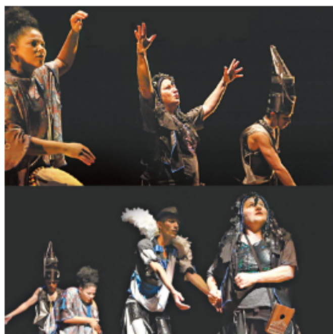
Cenas do espetáculo "Compilation", da Cia Vatá