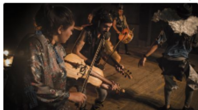
O espetáculo Compilation é inspirado nas danças do coco, cabaçal, maracatu e reisado