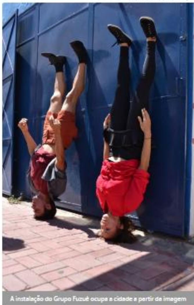
A instalação do Grupo Fuzuê ocupa a cidade a partir da imagem

Parceiro da Associação Cultural Artelaria Produções, o Grupo Fuzuê - em atividade desde o ano de 2004 - encontra-se em cartaz com seu novo espetáculo. Instalação Desistência Poética poderá ser visto hoje e na próxima quinta-feira, sempre a partir das 10 horas, pelas ruas do Centro de Fortaleza.